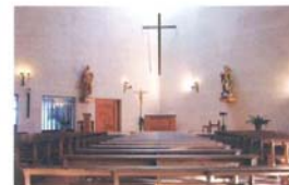
Iglesia: (550 personas).