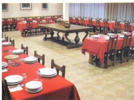
Comedores: Abantos: (100 personas). San Lorenzo: (200 personas). Escorial: (250 personas).