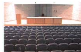
Teatro: (500 personas).

El precio de las habitaciones con pensión completa es: