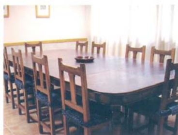
Salas de reunión: (desde 20 a 80 personas).