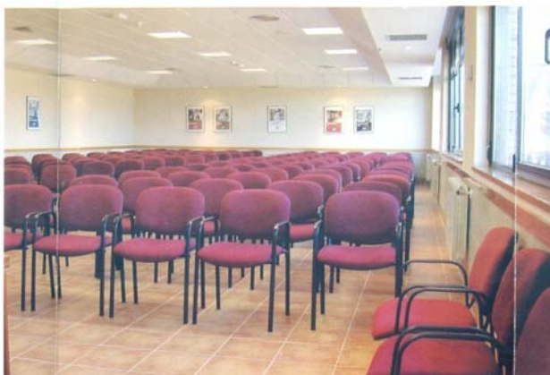
Salones: P. Damián: (150 personas), S. José: (150 personas).