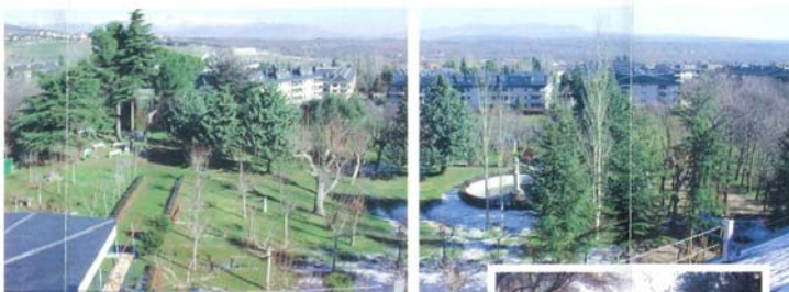
La finca cuenta con una superficie de 42.000 metros cuadrados, con grandes espacios ajardinados, variedad de árboles, piscina y unas magníficas vistas.